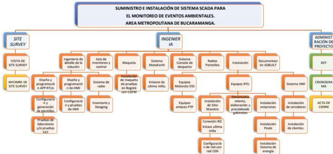
Ilustración 1: EDT

remoto a través del sistema de radio del CGFM, e integrar las 5 estaciones Hidrológicas, 1 estación Meteorológica y 5 estaciones de Calidad del Aire, con los sensores e instrumentación con los que actualmente cuenta el AMB. Esta información es transmitida gracias a la alianza estratégica entre la AMB y con el Comando General de las Fuerzas Militares, en el cual permite el uso de la Red Integrada de Comunicaciones Estratégicas ASTRO 25 (Red Troncalizada con Cobertura Nacional que permite integrar en el departamento comunicaciones de Audio y Datos). La información es recibida y recolectada en servidores propios del AMB, suministrados dentro del marco del proyecto, y visualizados en sala de monitoreo de Alertas Tempranas. Como sistemas de apoyo, se contempla la geolocalización de radios, los radios portátiles para el personal administrativo y operativo del AMB, consola de despacho de personal, entre otros. En la siguiente grafica EDT, se puede observar los paquetes de trabajo del proyecto.