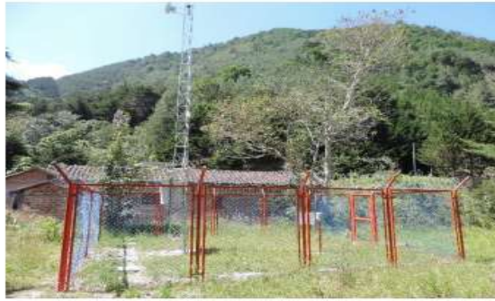
Centro de monitoreo y enlace de comunicaciones