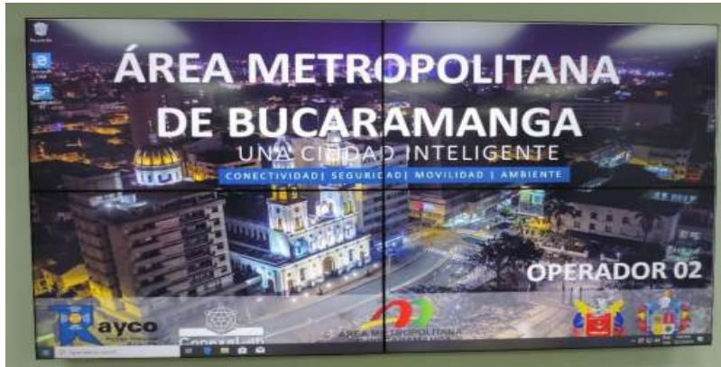
Enlace de comunicaciones con el Comando General Fuerzas Militares.