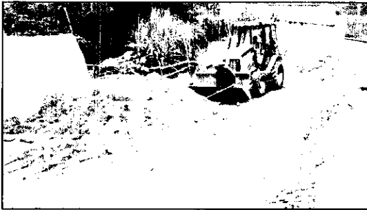
Figura 1. Tierra de excavación ubicada en una Zona aislada de los árboles.