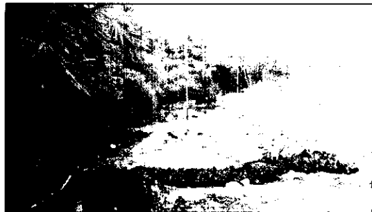
Figura 4. Vista general del Parque Las Mojarras

Teniendo en cuenta lo anterior quedamos atentos a cualquier inquietud, la cual será atendida con gusto en este Despacho, ubicado en la Avenida Los Samanes No. 9-140 Local 300 del Centro Comercial Acrópolis, y/o en el teléfono 6414822.