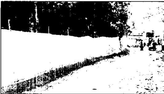
Figura 3. Área de árboles aislada del resto de la obra.