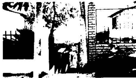
Callejón frente a la gruta.

De esta manera, la información suministrada por usted resultó confusa e incompleta por lo que no se puede tomar ninguna determinación respecto a su denuncia.