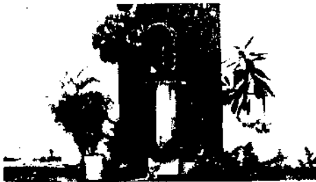
Altos de Villabel. Gruta en la carrera 7.