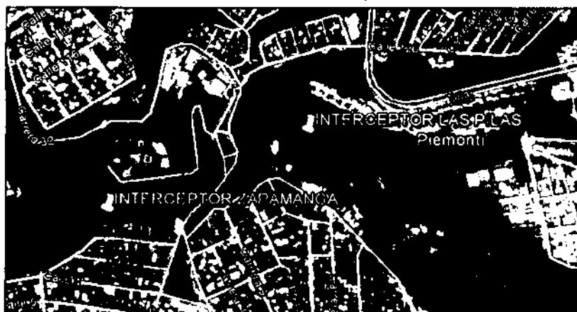
Fotografía 1 Ubicación

En atención del asunto, el equipo técnico de la Subdirección Ambiental - SAM del Área Metropolitana de Bucaramanga, realizó visita de seguimiento durante los meses de abril y mayo de 2017, al sector comprendido entre la confluencia de la quebrada Las Pilas y la quebrada Zapamanga y el Colegio Metropolitano del Sur Sede A, ubicado en la carrera 12 con calle 2 del Barrio Nuevo Villabel, con el fin de verificar las actuaciones realizadas por la Empresa Pública de Alcantarillado Empas S.A. E.S.P. sobre la afectación ambiental por el vertido de aguas residuales sobre la Quebrada Zapamanga. Durante la inspección se pudo evidenciar la siguiente situación generada en dos sitios: